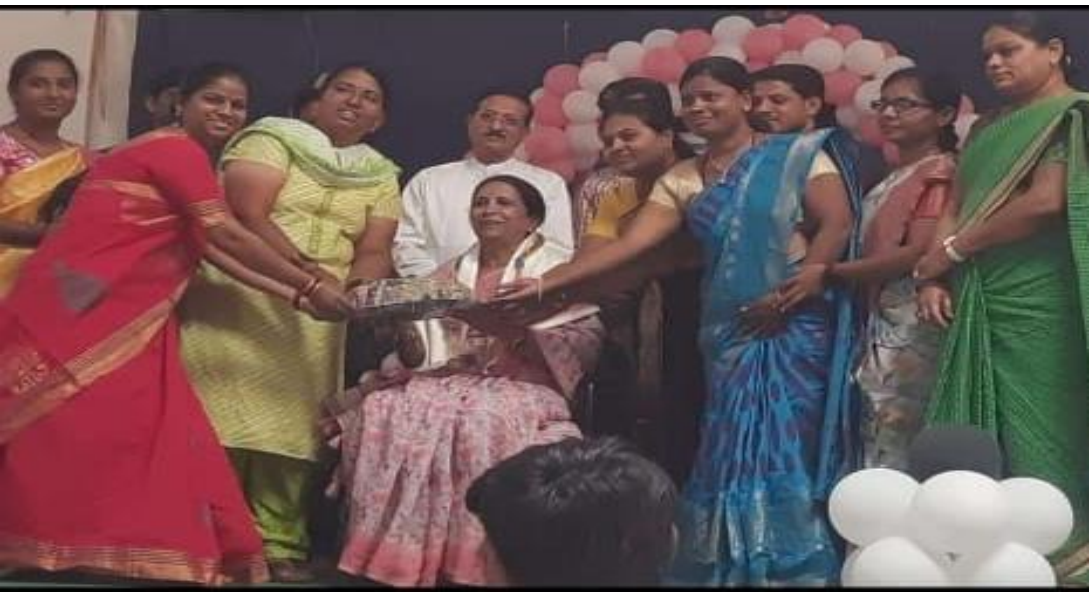
WWF Members With Management On The Occasion Of Independence Day