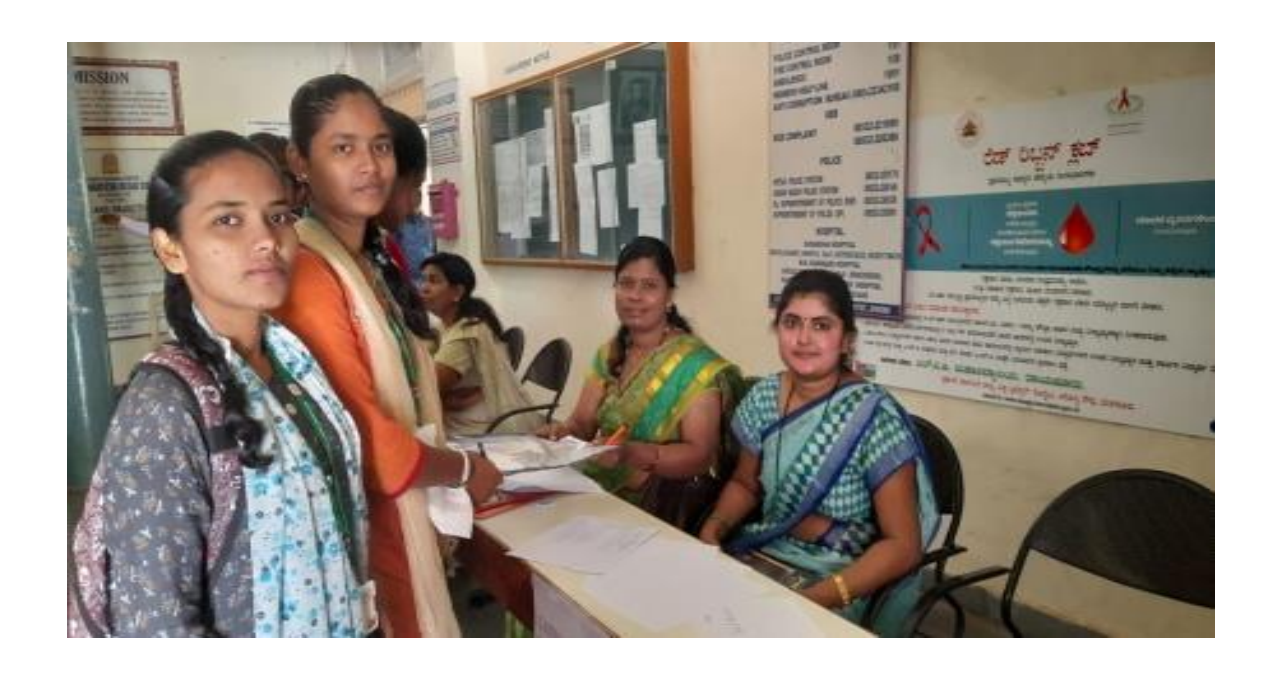
Language Forum Organized By Savitri Bai Phule Jayanti