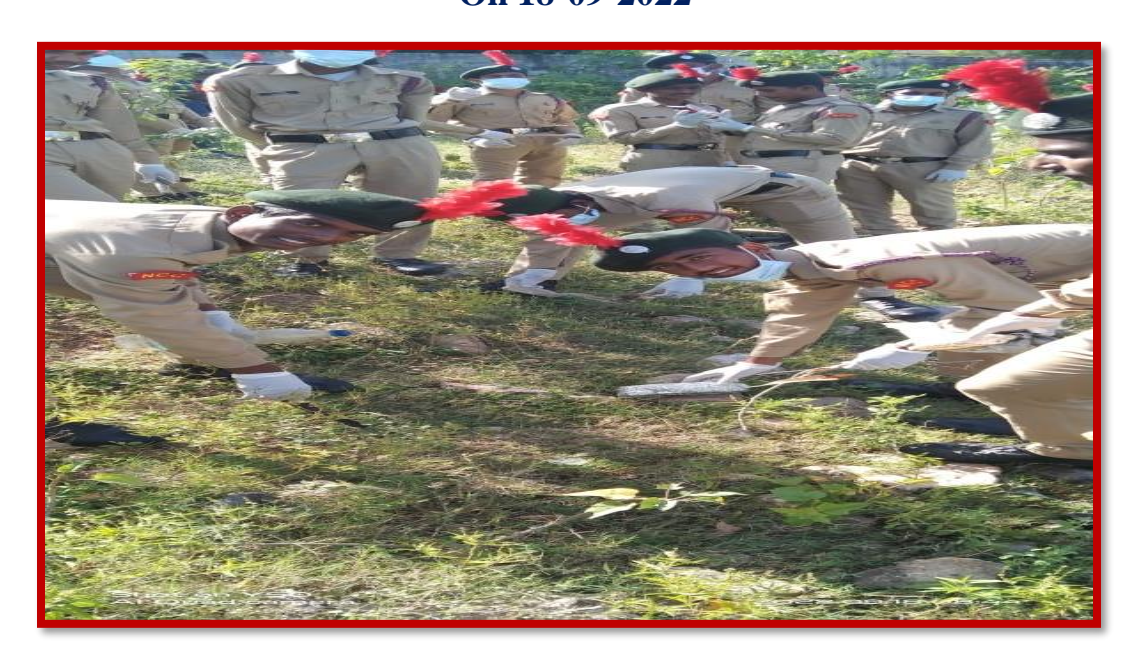
25 Tree Plantation At Slum Area Timmapurpet Raichur Conducted By 35kar Bn Ncc Raichur Dated ON 26<sup>th</sup> NOVEMBER 2022